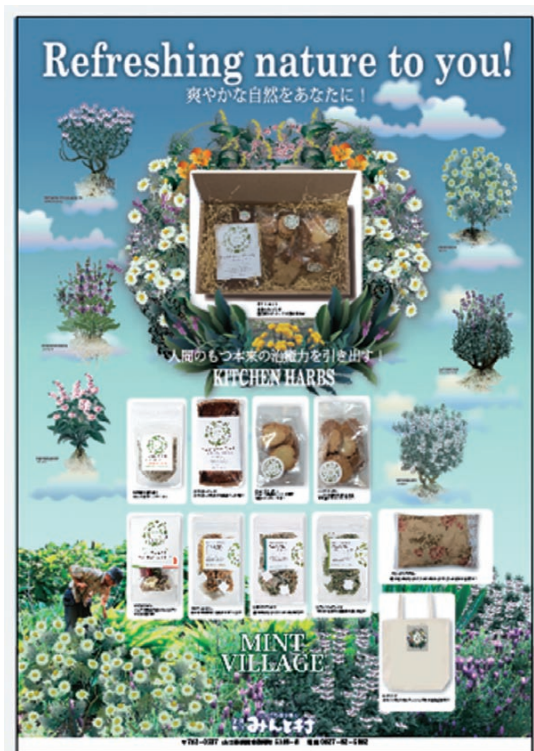
新しいパッケージの商品MAP

そのような中、平成20年に岩国市のハーブが地域資源に認定され、平成22年には、山口県有機農産物認証