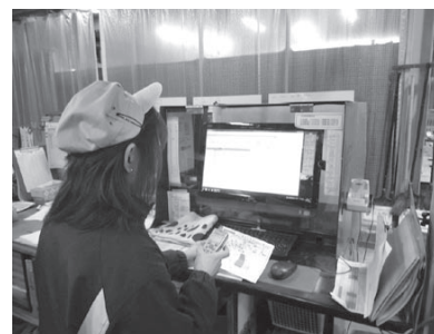
生産管理システム