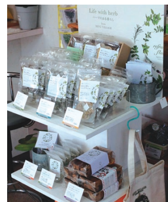
売り場づくりのための商品展示台