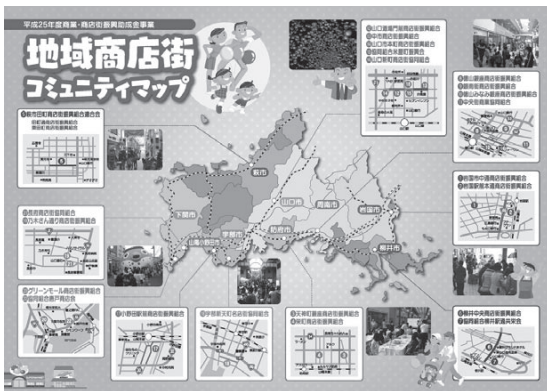
地域商店街コミュニティマップ

マップには、県内の主要な22商店街の年間イベントが掲載されており、一目で開催時期がわかるようになっていきます。