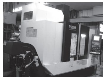
マシニングセンタ