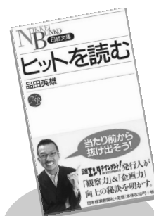
著書「ヒットを読む」 (日経文庫、2005年11月)

現在、日経MJにて『ヒットの現象学』を連載。著書に『ヒットを読む』(日本経済新聞社 日経文庫)ほかがある。日本テレビ「PON!」に水曜レギュラーとして出演中。これまでに経済産業省「映像プロデューサー人材育成支援事業委員会」委員、国土交通省「東京圏における国際文化拠点整備委員会」委員等を努めた。