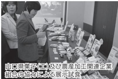
山口県菓子(工)及び農産加工関連企業 組合の協力による展示試食