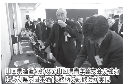
山口県酒造(協)及び山口県青年醸友会の協力 により県内日本酒18銘柄の試飲会が実現