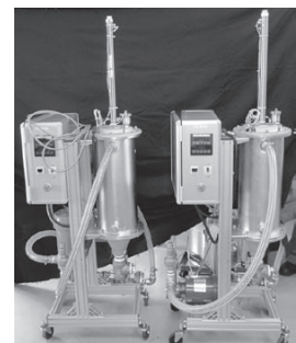
フィルトレーションユニット組立完成品