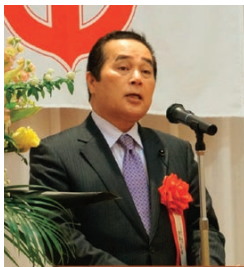
畑原基成 山口県議会議長