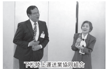
下松陸上運送業協同組合