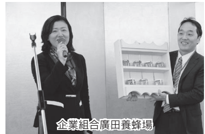
企業組合廣田養蜂場