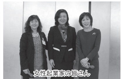
女性起業家の皆さん