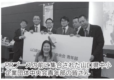
PRブースの前に集合された山口県中小 企業団体中央会青年部の皆さん