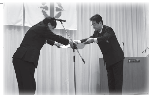
中小企業庁長官表彰 (山口県トラック事業協同組合)