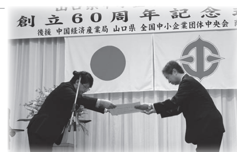
中国経済産業局長表彰 (山口県パン工業協同組合)