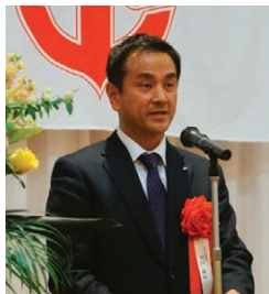
村岡嗣政 山口県知事