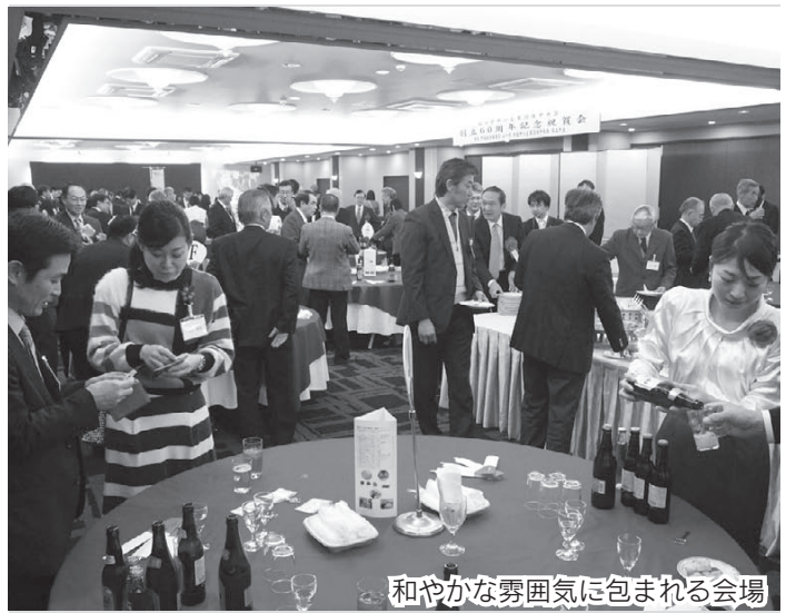
和やかな雰囲気にもまれる会場