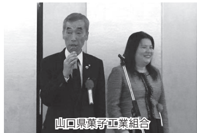
山口県菓子工業組合