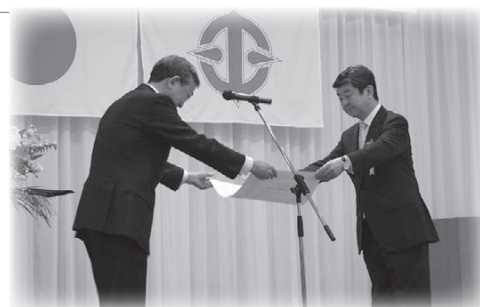
全国中小企業団体中央会会長表彰 (防府流通センター協同組合)

日立笠戸協同組合陸会 (日立笠戸協同組合) 山口県電気工事工業組合青年部 (山口県電気工事工業組合)