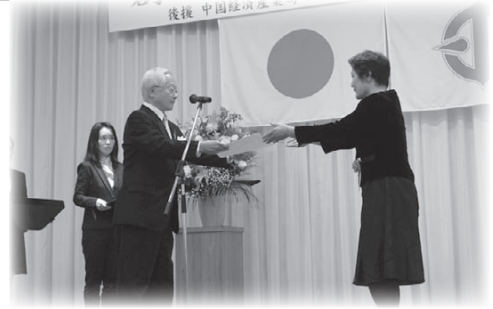
山口県中小企業団体中央会会長表彰 (企業組合うずしお母さんの店加工部)