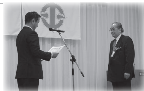
山口県知事表彰 (湯本温泉旅館協同組合)

湯本温泉旅館協同組合 山口県左官業協同組合 山口県酒造協同組合 山口県流通センター卸事業協同組合 萩阿武トラック事業協同組合