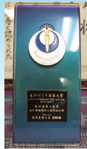
第2回ものづくり日本大賞