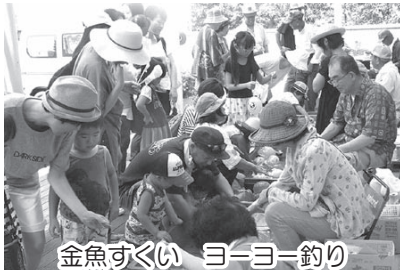
金魚すくい ヨーヨー釣り