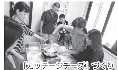
「カッテージチーズ」づくり