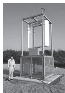
試作開発した小型風力発電機