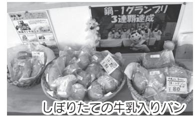
しぼりたての牛乳入りパン

当組合は、池田牧場のしぼりたての新鮮な牛乳や近隣の農産物を使って、農家レストラン「ミルクキッチン燦・燦」として平成26年12月にオープンし「やまぐち食彩店」に認定されました。また、防府市の中心商店街で開催される『鍋1-グランプリ』では3連覇を達成した料理自慢の企業組合です。