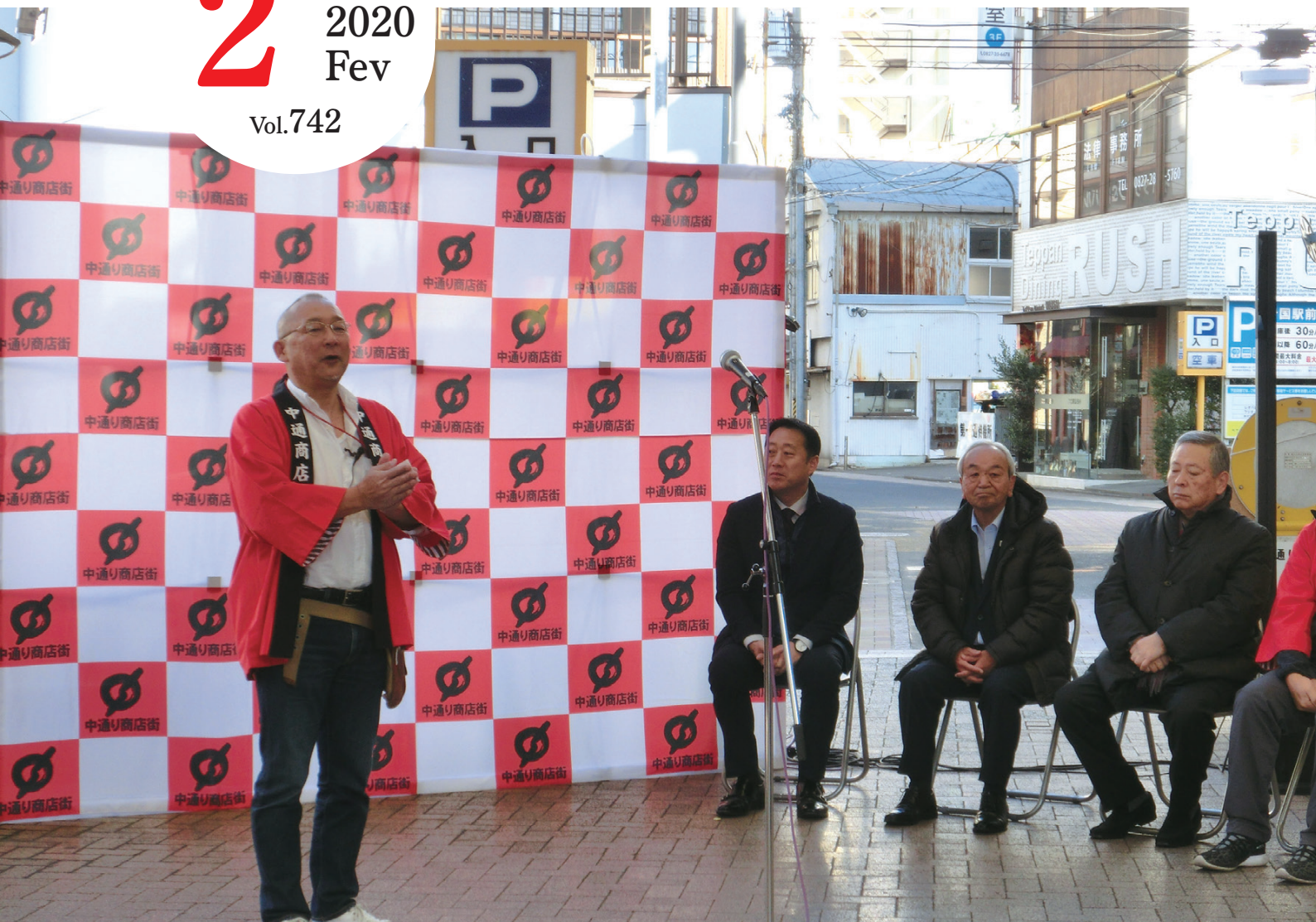
表紙写真：岩国市中通商店街振興組合（軽トラ新鮮組!十周年祭）