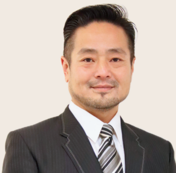
中小企業連携協同組合 Shingari 理事長

事業協同組合を立ち上げ、新たな「ビジネス」と 「まちづくり」の融合を実践する経営者が集う！