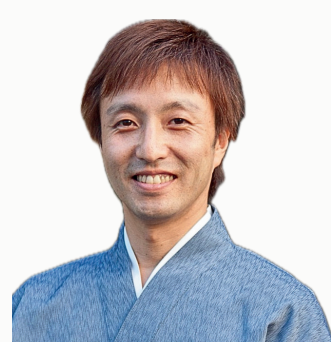
株式会社寿美れ 代表取締役社長