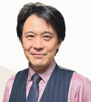
アシストプラス株式会社 代表取締役