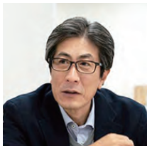
講師・メンター・ KATARI-BAR登壇

京都大学法科大学院を卒業後、スタートアップ向け法律事務所として活動。知的財産や資金調達に関する契約業務などに従事。その後、株式会社アカツキにジョイン。管理部門の立ち上げ、IPO業務の担当として、上場へ貢献。岡山県に帰郷後、クリエイターのパートナー事業「しろしinc.」、教育事業「無花果高等学園」、瀬戸内エリアに特化したVC「Setouchi Startups」をはじめ。