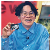
講師・メンター・ KATARI-BAR登壇

家業の業務用酒販店に跡継ぎとして入社後、傍らでWebサービスを複数立ち上げ起業。現在は「地方学生のための長期インターン求人COMPUS」の運営に注力している。2021年にVCファンド「SetouchiStartups」を創業。瀬戸内エリアにゆかりのあるシード期のスタートアップへの投資を行っている。2024年ForbesJapan Small・ジャイアントイノベーターに選出。