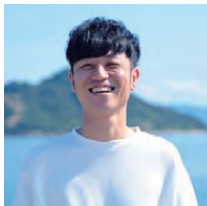
講師・メンター・ KATARI-BAR登壇